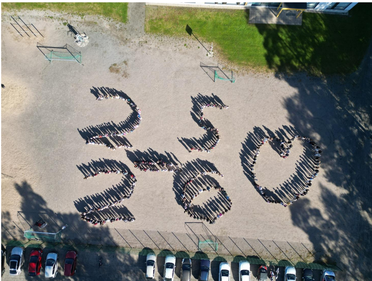
Koulunmäen oppilaat ja henkilöstö ensimmäisenä koulupäivänä syksyllä 2025.

Lukiokursseja pystyttiin jälleen toteuttamaan laajasti ja laadukkaasti. Yhteisten resurssien käyttö yhtenäiskoulun kanssa takasi jokaiseen aineeseen pätevän opettajan. Paikallisina opintojaksoina tarjottiin liikuntavalmennuksen lisäksi kansainvälisyystoimintaa sekä merkittävä määrä lähinnä yo-kirjoituksiin tähtäviä kertauskursseja ja esimerkiksi hyvinvointitaitoja.