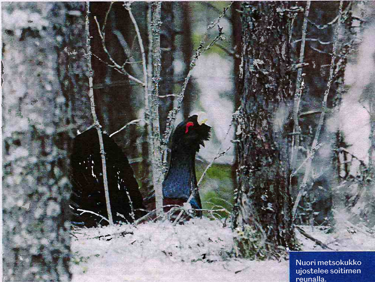
Nuori metsokukko ujostelee soitimen reunalla.