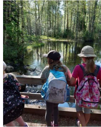
Herkkuja, yhdessä oloa ja lähiluonnon kauneutta.