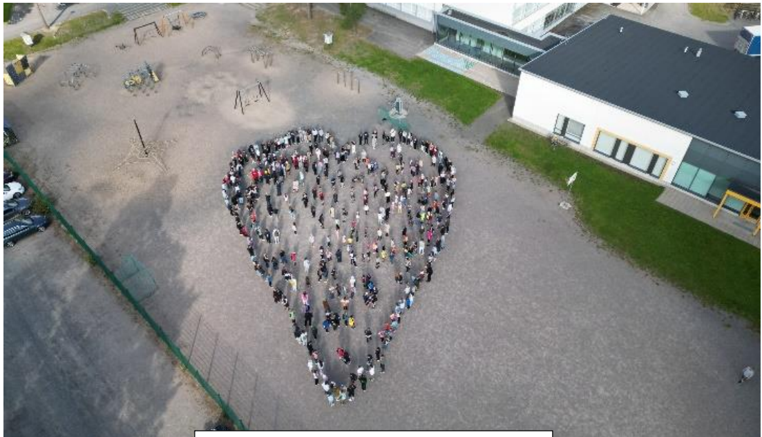
Koko koulun väen muodostama sydän.

Jatkoimme tänä lukuvuonna jokaisen luokan, eskareista abeihin, omia aamunavauksia, jotka toivat piristystä keskiviikko aamuihin. Oppilaskuntatoiminta kokoontui säännöllisesti lukuvuoden aikana ja he pohtivat asioita lukuvuoden teeman kautta. Yläkoulun tukioppilaat suunnittelivat pieniä tapahtumia kouluarjen lomaan. Lisäksi vanhempaintoimikunta kokousti säännöllisesti. Yrittäjyyskurssilaiset toivat, väriä koulupäiviin tehden pop up -kioskeja lukuvuoden aikana. Kansainvälisyystoiminta toi ryhmän saksalaisia ja martiniquelaisia ja heidän opettajiaan koulunmäelle. Oppilaat pääsivät harjoittelemaan englannin kieltä ja vieraiden kunnioittavaa kohtaamista.