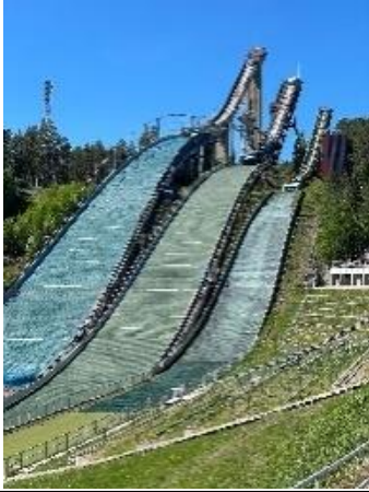
6:lk tutustumassa Lahdessa.