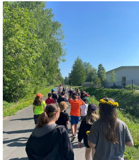
Oppilaita retkellä kevään vehreydessä.

Tänä lukuvuonna perusopetuksen ja lukion tiimit olivat: hyvinvointitaitojen opetustiimi, hyvinvointitiimi, eriyttämisen tiimi, tyhyttiimi, tapahtumatiimi, lv-tiimi ja ro-tiimi. Kaikki tiimit toivat koulun arkeen ja toimintakulttuurin kehittämiseen oman panoksensa.