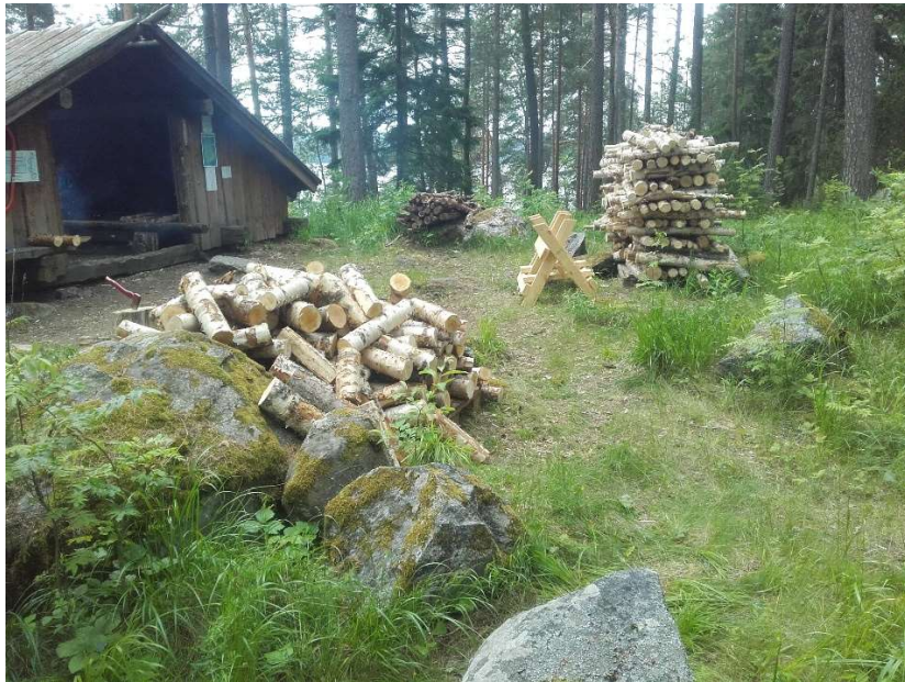
(Kuva: Vesijärven Selkäsaari, Petri Solonen 2022)

Toimintavuoden päätteeksi osapuolet totesivat, että kohteet ovat hyvässä kunnossa, mutta tarvitsevat jatkossakin vuosittaista huoltoa ja kunnostamista. Etenkin laitureiden kansirakenteet ja saunojen katot vaativat korjaamista ja uusimista.