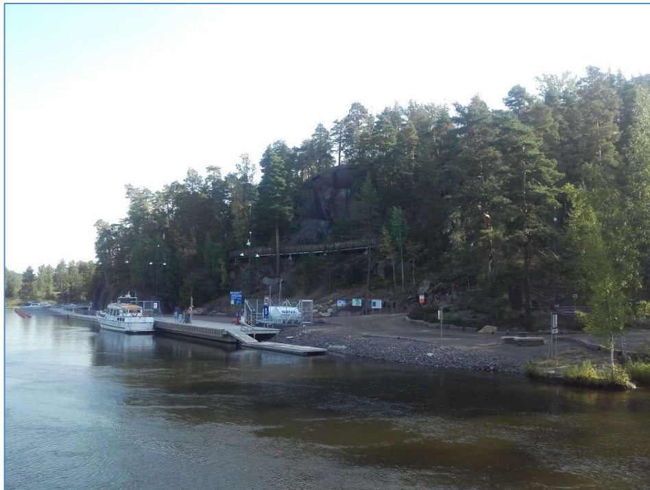
(Kuva: Kuusankosken Virtakiven sataman laiva- ja huoltolaituri)

Yhdistyksen taseessa on varauduttu tulevaisuuden maanhankintaan ja kohteiden pe- rusparannuksiin.