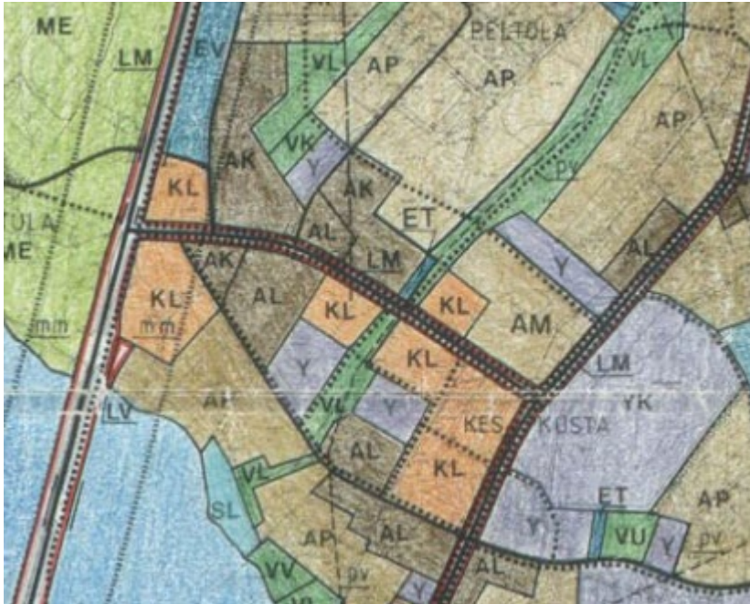
Kuva 3. Ote Joutsan Kirkonkylän oikeusvaikutuksettomasta yleiskaavasta 1990-luvulta. Yhdystie kuvassa keskellä.

Joutsan kirkonkylällä on voimassa oikeusvaikutukseton aluevaraustyyppinen yleiskaava 1990-luvun alusta.