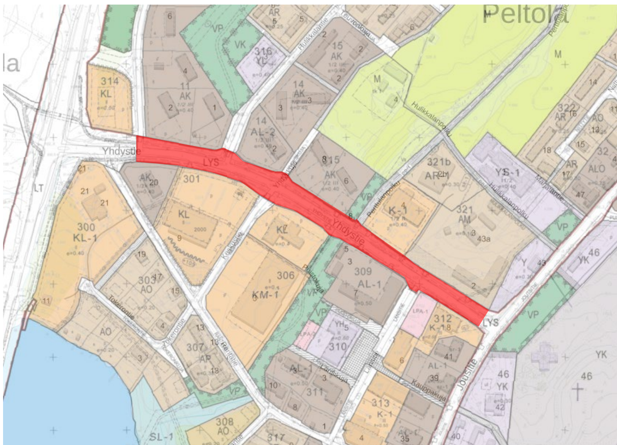
Kuva 1. Yhdystien kaduiksi muutettava maantiealue punaisella.

Asemakaavamuutos laaditaan Joutsan kirkonkylään Yhdystielle (16646), joka asemakaavassa on osoitettu liikennealueeksi (noin 0,6 km).